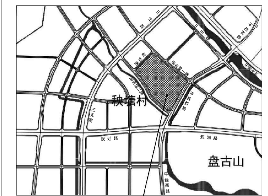
本项目位置 项目位置示意图